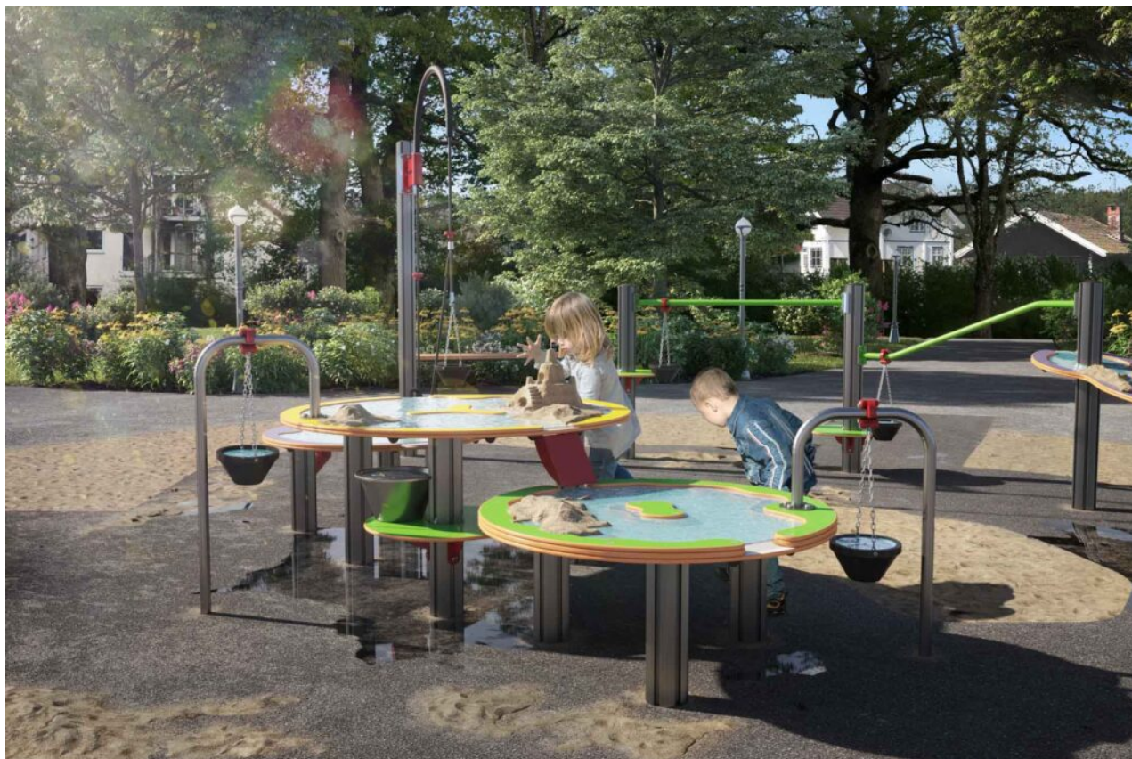
Vann og sandbord trippel med kraner